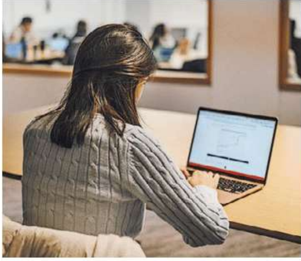
WISCONSIN International students stay away.