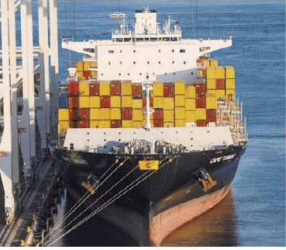
WASHINGTON Tariffs stall careers at a port.