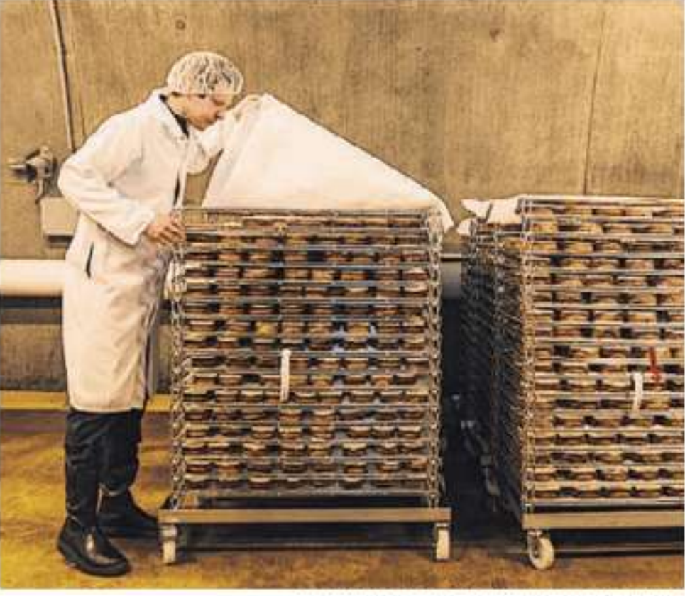
VERMONT Fewer Canadians visit and shop.