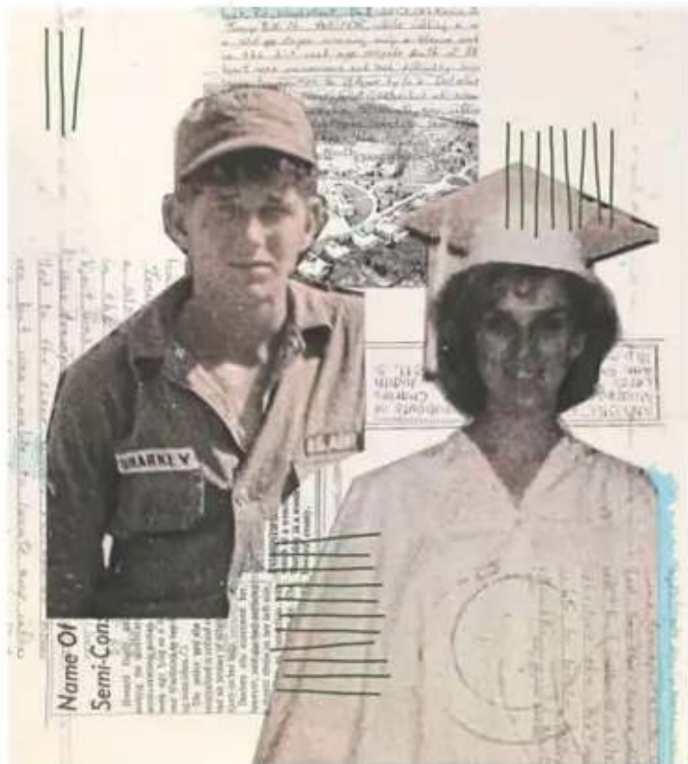
ILLUSTRATION BY ANNA LEFKOWITZ/THE WASHINGTON POST

The woman was rushed to a hospital, where doctors noticed bruises darkening across her abdomen, apparently from a beating. She also had suffered a stroke. A blood clot lodged in her right carotid artery had starved her brain of oxygen.