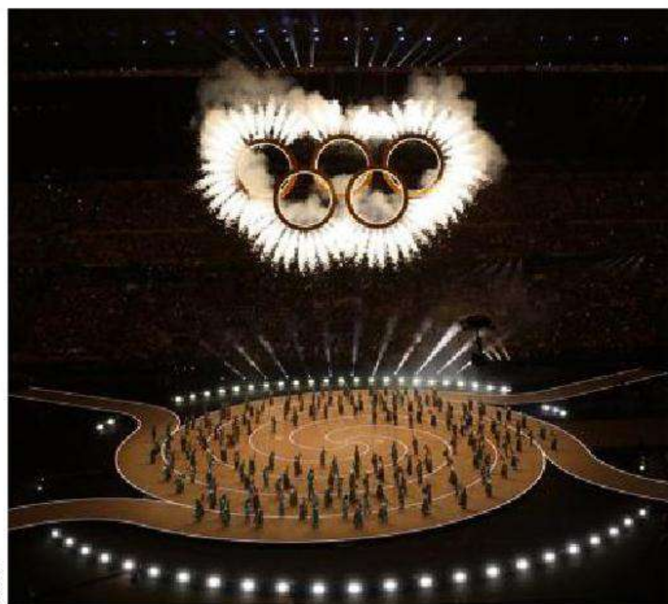
Au stade San Siro, à Milan, le 6 février.