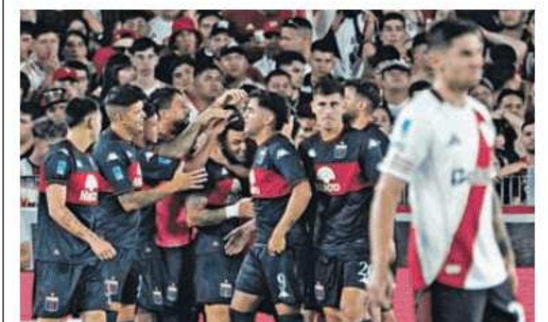
Arrollador. Tigre, ante un River sin reacción.

"Es un acto de justicia histórica", afirmó el Presidente en Santa Fe, en el acto de entrega del sable corvo del general San Martín a los granaderos. Ayer, una multitud despidió esa pieza del Museo Histórico Nacional. P.10