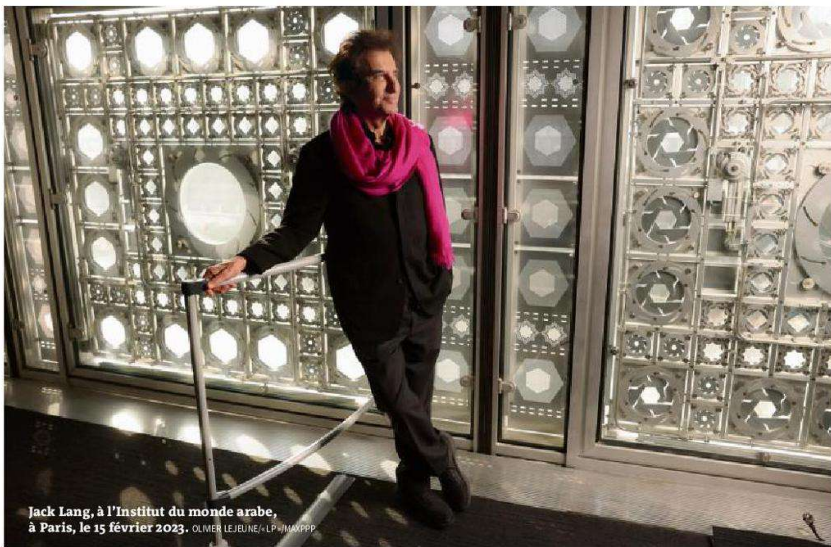
Jack Lang, à l'Institut du monde arabe, à Paris, le 15 février 2023.