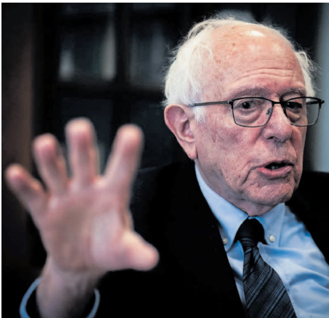
Bernie Sanders, el miércoles durante la entrevista en el Capitolio.

Sanders habla, con voz grave y mirada esquiva, ante una foto en blanco y negro del reverendo Jesse Jackson otro día más de nieve en la capital. Y reflexiona sobre la política migratoria de la Administración estadounidense que, con miles de deportados y dos polémicas muertes, ha sembrado el terror en el país. El presidente está usando el ICE, la policía migratoria, como “un ejército doméstico”, observa. Pero deja una frase para la esperanza: “No solo derrotaremos al trumpismo, crearemos un país mucho más justo y equitativo”. —P2 Y 3