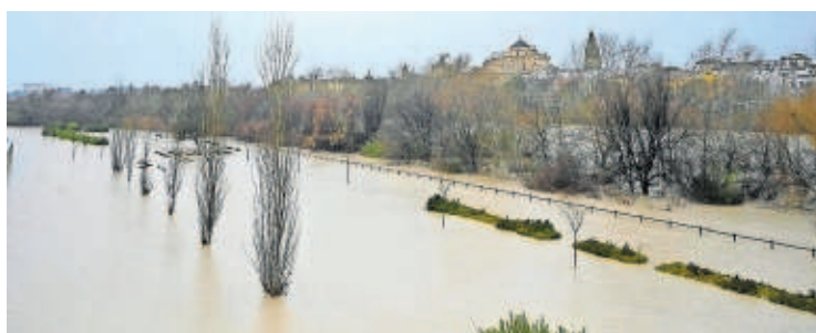
El Guadalquivir a su paso por Córdoba, ayer.

guna familia aquí”, decía una vecina de Majaneque (Córdoba). La intensidad de las lluvias obligó a nuevos desalojos —ya son más de 11.000—, causó numerosos daños y llevo al presidente de la Junta de Andalucía, Juan Manuel Moreno, a pedir ayuda al Gobierno para la reconstrucción. Los destrozos se estiman en 500 millones solo en carreteras y en 3.000 millones en el sector agrícola. —P27 A 29